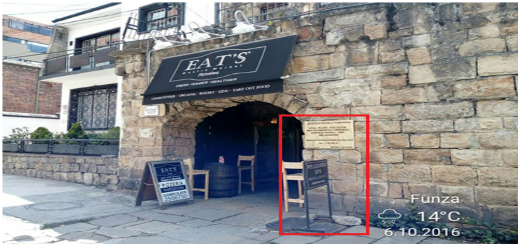
Fotografía No. 1: Panorámica del Aviso del establecimiento MICHEL EDUARDO ASESORIA DE IMAGEN Y ESTETICA, ubicado en la Carrera 3 No. 74 – 32, elemento tipo aviso en fachada

Registro fotográfico, Visita No. 2 efectuada el día 17/11/2016.